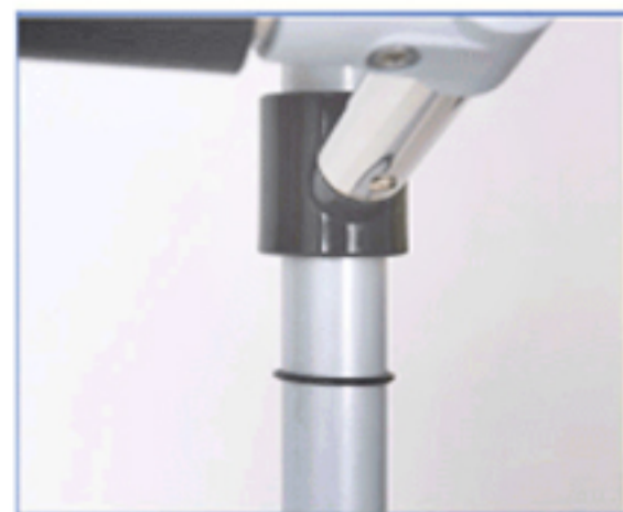
• 손잡이 팔받침 높낮이 조절