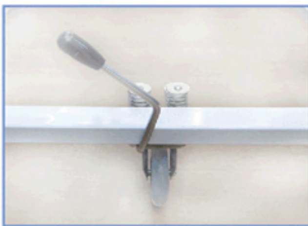
• 회전시 전환레버