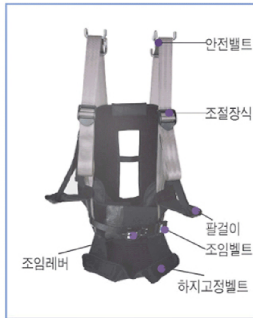
• 자켓 세부명칭