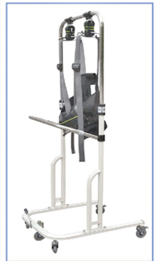
• 자켓탈부착이 용이함.